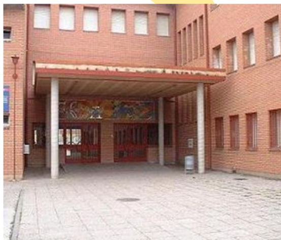
I.E.S. ALDEBARÁN Fuensalida